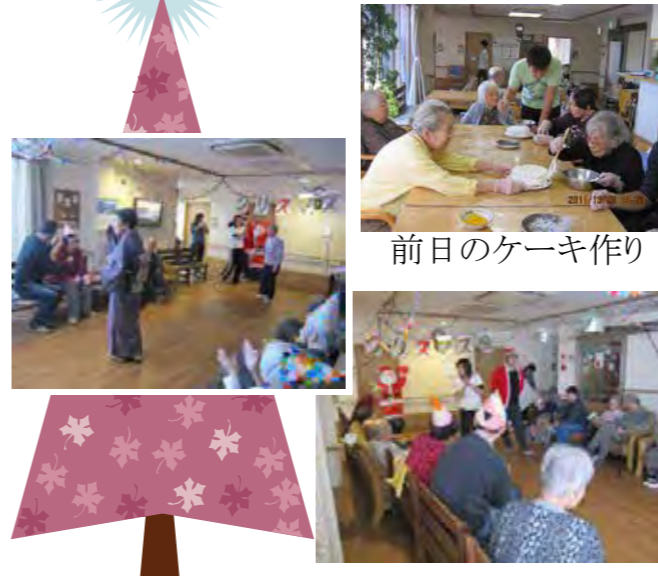
前日のケーキ作り

前日に入居者様と一緒に作ったケーキをおやつに食べ、一年を締めくくる楽しい一日になりました。